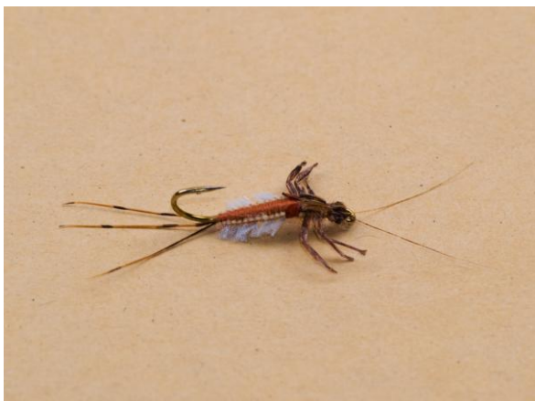
Tretje mesto v kategoriji ličink- "Ephemera Nymph" Huguesa Silvaina iz Francije