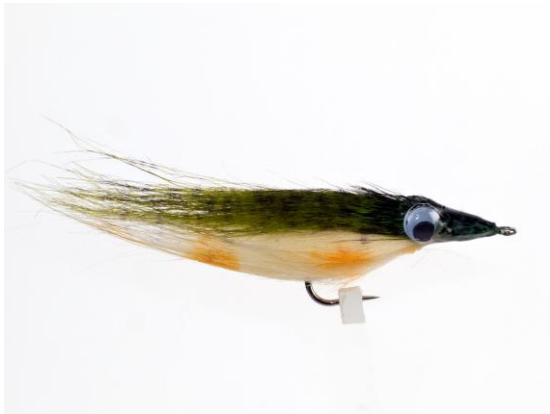
Tretjeovrščeni izdelek v kategoriji potezank - "Luccio Pike" Erosa Tomassija iz Italije