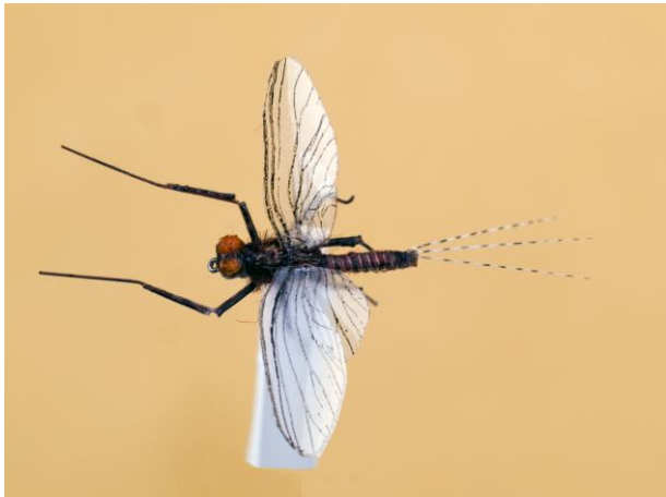
Druga v državnem in četrta v odprtem prvenstvu v kategoriji realističnih posnetkov- "Ephemerella Subvaria" Uroša Mahneta iz Ilirske Bistrice